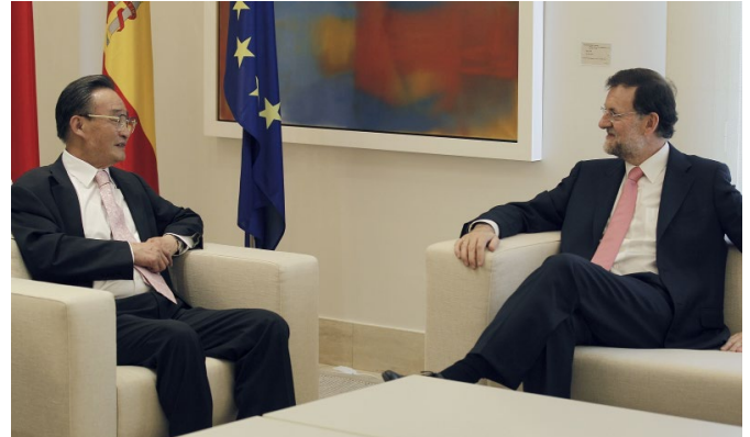
El presidente del Gobierno, Mariano Rajoy, junto al presidente de la Asamblea Nacional Popular de China, Wu Bangguo, durante su visita a Madrid, en mayo de 2012.

Presidente: Xi Jinping Primer Ministro: Li Keqiang Viceprimeros Ministros: Zhang Gaoli, Liu Yandong, Wang Yang, Ma Kai Consejeros de Estado: Yang Jing, Chang Wanquan, Yang Jiechi, Guo Shengkun, Wang Yong Ministro de Relaciones Exteriores: Wang Yi Ministro de Defensa Nacional: Chang Wanquan Ministro encargado de la Comisión Nacional de Desarrollo y Reforma: Xu Shaoshi Ministro de Educación: Yuan Guiren Ministro de Ciencia y Tecnología: Wan Gang Ministro de Industria y Tecnología Informática: Miao Wei Ministro encargado de la Comisión Estatal de Asuntos Étnicos: Wang Zhengwei Ministro de Seguridad Pública: Guo Shengkun Ministro de Seguridad Estatal: Geng Huichang Ministro de Supervisión: Huang Shuxian Ministro de Asuntos Civiles: Li Liguo Ministra de Justicia: Wu Aiyang Ministro de Hacienda: Lou Jiwei Ministro de Recursos Humanos y Seguridad Social: Yin Weimin Ministro de Tierra y Recursos: Jiang Daming Ministro de Protección Ambiental: Chen Jining Ministro de Vivienda y Desarrollo Urbano-Rural: Jiang Weixin Ministro de Transportes: Yang Chuantang Ministro de Recursos Hídricos: Chen Lei Ministro de Agricultura: Han Changfu Ministro de Comercio: Gao Hucheng